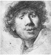
Rembrandt Harmensz. van Rijn, Selbstporträt mit aufgerissenen Augen und Baret , 1630

Radierung, monogrammiert und datiert: RHL 1630 , 51 x 44 mm