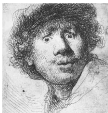
Rembrandt Harmensz. van Rijn, Rembrandt au bonnet la bouche ouverte , 1630 Eau-forte, signé et daté : RHL 1630 , 51 x 44 mm