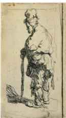
Rembrandt Harmensz. van Rijn, Bettler auf einen Stock gestützt, nach links , gegen 1630

Radierung, Kaltnadel und Grabstichel, 153 x 207 mm