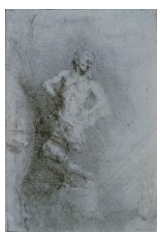
Rembrandt Harmensz. van Rijn, La Statue de Nabuchodonosor (une de quatre illustrations pour un livre espagnol) , 1655 Eau-forte, maculature (deuxième impression prise de la plaque sans ré-encrage), signé et daté : Rembrandt f. 1655 , 96 x 76 mm