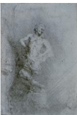
Rembrandt Harmensz. van Rijn, "Das von Nebukadnezar gesehene Bild", Eine von vier Illustrationen eines spanischen Buches , 1655

Radierung, Makulatur (zweiter Druck einer nicht wieder geschwärzter Kupferplatte), signiert und datiert: Rembrandt f. 1655 , 96 x 76 mm