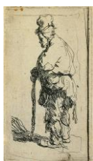
Rembrandt Harmensz. van Rijn, Mendiant debout, vu de profil, tourné à gauche, s'appuyant de la main droite sur son bâton , vers 1630 Eau-forte, 86 x 48 mm