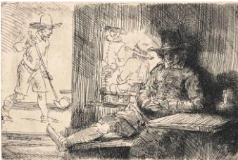
Rembrandt Harmensz. van Rijn, Der Golfspieler ('Het Klosbaantje') , 1654

Radierung, monogrammiert und datiert: RHL 1630 , 98 x 83 mm