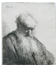
Rembrandt Harmensz. van Rijn, Old Man with a flowing Beard , 1630

Etching, signed with monogram and dated: RHL 1630 , 51 x 44 mm