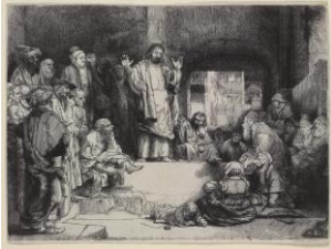
Rembrandt Harmensz. van Rijn, Christus predigend, genannt 'La Petite Tombe' , gegen 1652

Radierung, signiert und datiert: Rembrandt f. 1654 , 95 x 143 mm