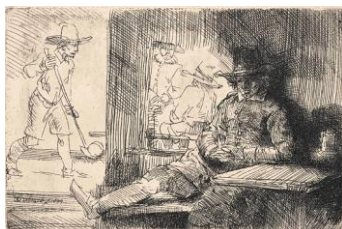
Rembrandt Harmensz. van Rijn, The Ringball Player ('Het Klosbaantje') , 1654

Etching, signed with monogram and dated: RHL 1630 , 98 x 83 mm