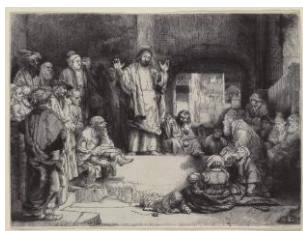
Rembrandt Harmensz. van Rijn, Le Christ prêchant ('La Petite Tombe') , vers 1652 Eau-forte, pointe sèche et burin, 155 x 208 mm