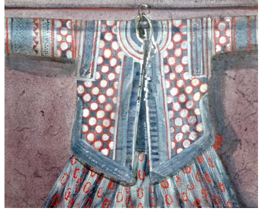
Veste Mhong Vietnam Nord Huile sur toile H. 0,40 m ; L. 0,50 m