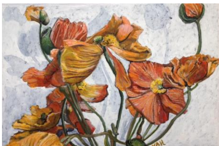
Pavots Huile sur toile H. 0,40 m ; L. 0,60 m