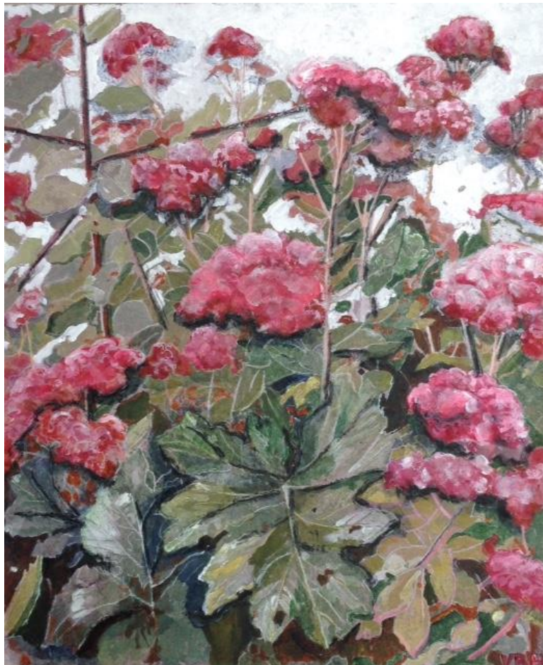
Sédums Huile sur toile H. 0,50 m ; L. 0,40 m

Ta personnalité ressort : du caractère, de l'optimisme à travers la couleur, l'harmonie de tes tons, ce côté "baroque" un désordre bien ordonné. Tes toiles sont originales, belles et féminines.