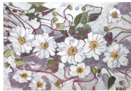
Anémone du Japon Huile sur toile H. 0,24 m ; L. 0,35 m