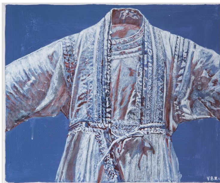
Manteau indien en soie Huile sur toile H. 0,40 m ; L. 0,50 m