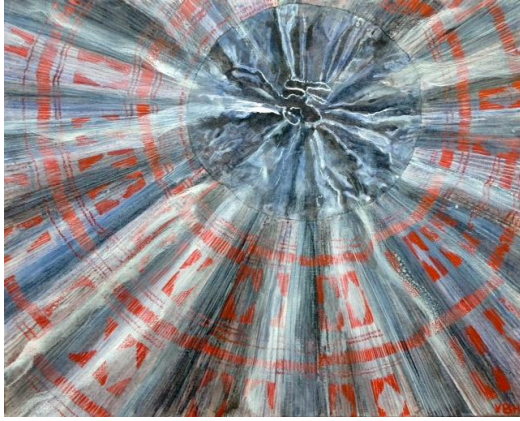
Jupe Mhong Vietnam Nord Huile sur toile H. 0,40 m ; L. 0,60 m