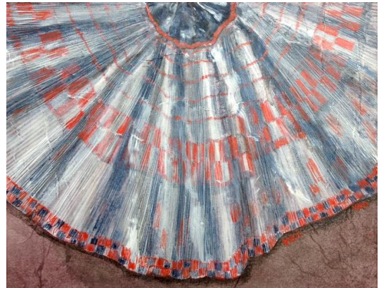
Jupe Mhong Vietnam Nord Huile sur toile H. 0,40 m ; L. 0,50 m